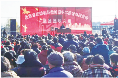
启东市王鲍镇长安村村民正在进行第十二届村民委员会换届选举

社会组织是打造共建共治共享社会治理格局的重要力量。2021年,市民政局以“质量提升”为主题,深入推进社会组织党的建设,全面加强社会组织管理。357家市属社会组织建立党组织或选派党建工作联络员;等级社会组织达到1890家,清理整治“僵尸型”社会组织944