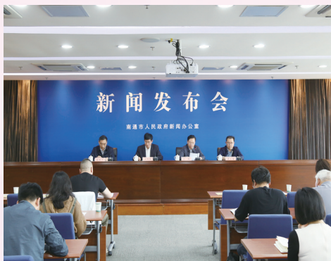
召开新闻发布会,在全省率先出台《关于改革完善社会救助制度的实施意见》

2021年4月,我市在全省率先出台《关于改革完善社会救助制度的实施意见》,积极构建以基本生活救助、专项社会救助、急难社会救助为主体,社会力量参与为补充的分层分类救助制度体系,提升民生保障能级,切实增进民生福祉。