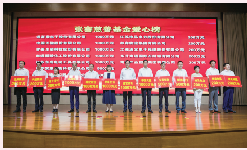
爱心企业向“张謇慈善基金”踊跃捐赠

享有基本公共服务是每个公民的基本权利。2021年以来,市民政局以满足人民群众多元化、多样化需求为发力点,着力提升婚姻、殡葬、地名等公共服务质量水平,不断增强人民群众的幸福获得感安全感。