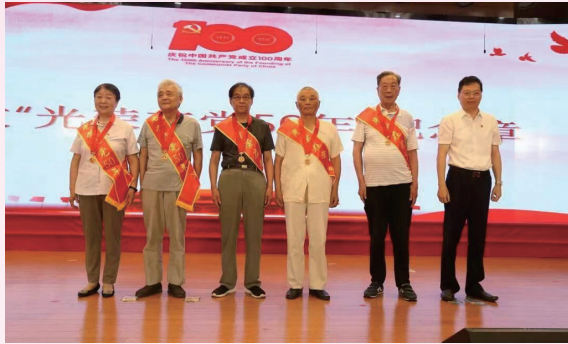
初心映民生 复兴续辉煌——为民政系统老党员代表颁发“光荣在党50年”纪念章

加大临时生活救助制度,筑牢救助“最后一道防线”。2021年,全市各级民政部门进一步优化困难群众临时生活救助制度,全市共计实施临时救助11864人次,支出1411.4万元。