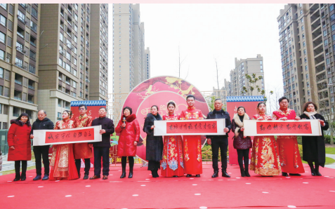
倡导文明婚俗,弘扬时代新风,举行集体婚礼

全面实现残疾人两项补贴资格认定申请“跨省通办”,将办理流程中的申请提交环节实现“跨省通办”,全面落实“最多跑一次”要求,实现“马上办、就近办、一地办”。不断提升殡葬服务水平。普遍实施惠民殡葬政策,大力引导殡葬移风易俗,认真推进殡葬行业专项整治行动。改扩建9个农村公益性骨灰安放(葬)设施,全市殡葬基