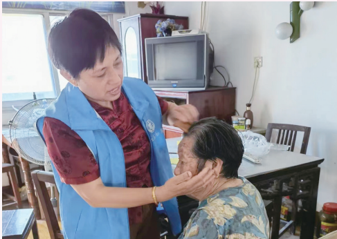
开展居家养老上门服务

积极构建未成年人保护体系,成立由35个部门组成的未成年人保护工作领导小组,10个县(市、区)均成立了未成年人保护协调机制。重点打造了7家能充分发挥示范引领和辐射作用的省级儿童“关爱之家”示范项目;制定出台南通市《农村留守儿童和困境儿童“关爱之家”建设运营规范》地方标准。全省率先探索建立事实无人抚养儿童“一事一议”认定机制,切实