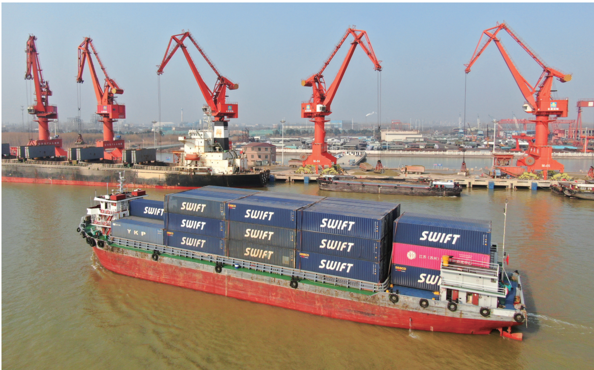
昨日拍摄的繁忙的如皋港长源国际码头。截至2月27日,如皋港长源国际码头今年散货吞吐量突破300万吨,达318.7万吨,同比增长19.2%。今年1月,长源国际码头创单月最高作业量纪录,实现“开门红”。

其间,检查人员对部分场所销货记录不及时、记录项目不全等问题当场提出整改意见,对涉及违法犯罪行为依法严厉打击。同时,要求经营户进一步落实食品安全主体责任、积极履行法定义务,确保产品来源可溯、去向可查、风险可控,同步扎实做好防疫、消毒工作,保证经营场所的环境卫生。