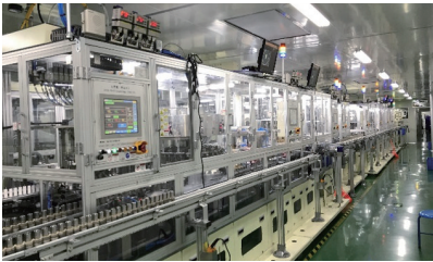
海四达DA全自动装配生产线

5G智慧车间的建立，大大减少了用工压力、人力成本，年人工费用减少约600万元；有效提升生产效率及经济效益，车间总体成品良率达99.4%，远超行业标准，公司产品核心竞争力进一步提升。相较人工作业，5G智慧车间项目年产能提升约300MW，领先于当前行业生产水平。