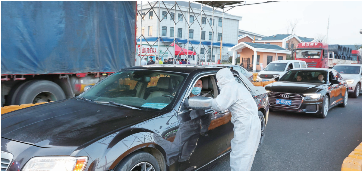
15日，工作人员在锡通高速南通西收费站查验点忙碌。按照江苏省交通口岸防控组要求，当前，各地在查验点严格查验14天内有涉疫地区旅居史的来苏返苏人员的核酸检测阴性证明及健康码，做到逢车必查、逢人必验。记者 许丛军摄

网友的反应也十分热烈，南通发布微信公众号发出这一通告后数小时，浏览量就超过了十万。“少一次聚会，朋友的感情不会变淡！”网友淼淼说。“全力配合疫情防控，不给政府添麻烦，每个人都是疫情防控第一责任人。”网友兵歌表示。本报记者 李波