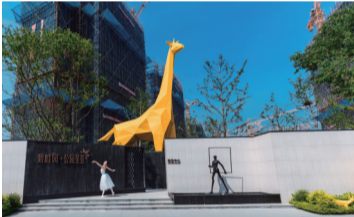
云系-南通碧桂园公园星荟

未来,碧桂园将以加倍的诚意与专注,持续深耕南通,保持初心,坚守匠心,做好产品与服务。