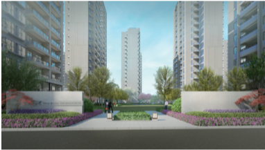
星系-南通碧桂园都会星宸