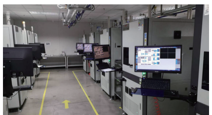
丽智电子生产设备管控 丽智电子(南通)有限公司累计在智能设备、软件、智能终端等方面投入3亿元,建

近年来,南通以发展新一代信息技术产业为突破口,培育经济新增长点和经济发展新动能,使之成为加快建设国家创新型城市、打造创新之都的重要路径。目前,该产业已形成通信产品、集成电路封装、电子元件、电子器件四大主导板块,许多企业在“智改数转”方面表现突出,成为具有行业示范价值、创新价值的典范。