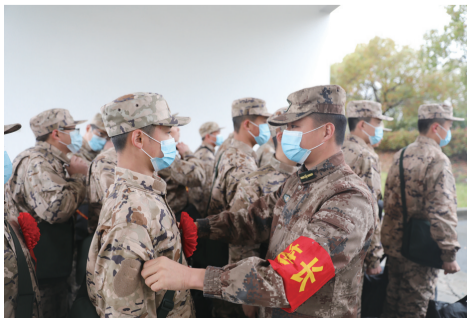
役前教育集训队连长再三叮嘱新兵。