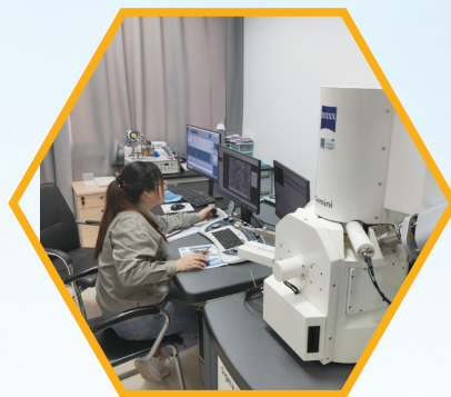
江苏容汇通用锂业研发生产两不误