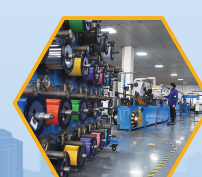
通光集团生产车间