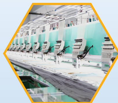
美罗家纺自动化生产线