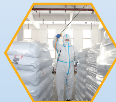
南通环球塑料原材料消毒