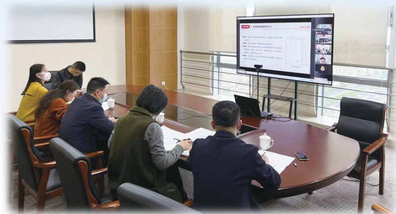
海门开发区项目云洽谈

今年以来,面对严峻复杂的疫情形势,海门始终坚持疫情防控与经济增长并重,强化稳工业专班适时调度和帮扶举措,落实落细各项惠企政策措施,工业经济持续稳定向好。来自海门发改委的统计数据显示,今年首季海门实现工业入库税金14亿元,同比增长36.4%;296家工业骨干企业累计完成应税销售230.9亿元,同比增长12.2%,实现入库税金8.5亿元,同比增长25.3%。