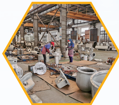
南通爱思轻合金生产车间