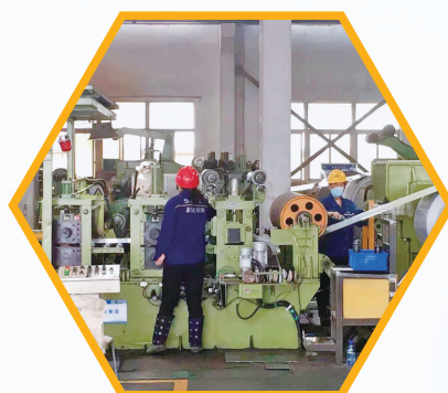
森达装饰材料智能车间