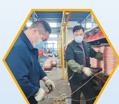
南通海腾铜业产销两旺