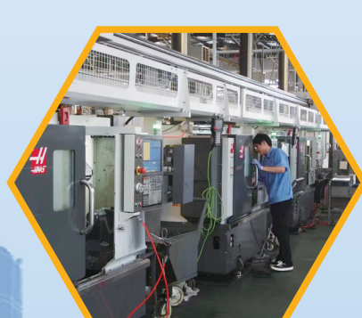
余东镇亿峰机械零部件制造生产车间