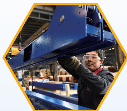
路特利举升机生产车间