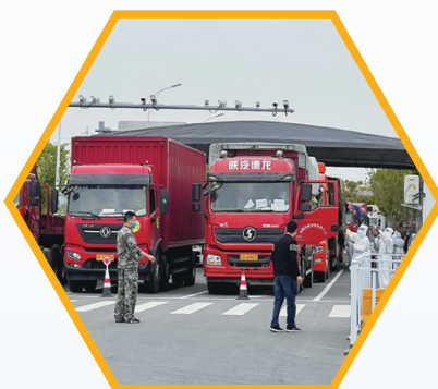
保障企业运输通行