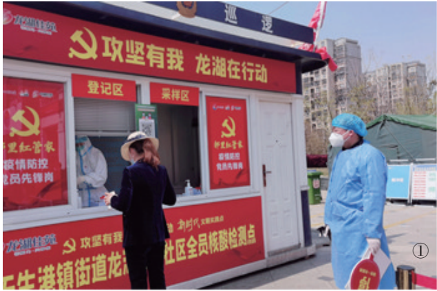
① 天生港镇街道龙湖佳苑核酸采样点。