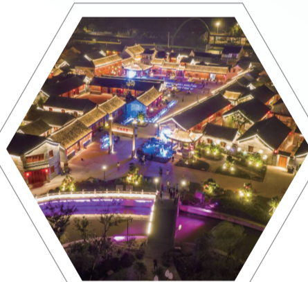
唐闸北市工业旅游区