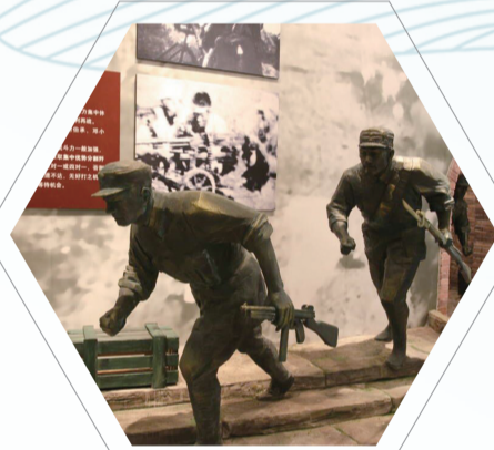
苏中七战七捷纪念馆