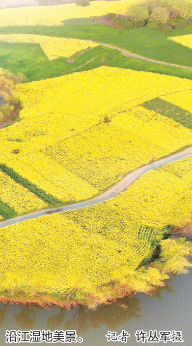
沿江湿地美景。

式,合理规范利用湿地资源,促进区域经济社会高质量发展。同时,加大湿地保护法宣传普法和湿地保护监督执法力度,严肃查处破坏湿地、违规占用湿地等违法行为,守护好“地球之肾”。