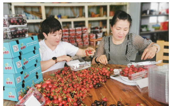
3日,尹园樱桃种植家庭农场工作人员分拣樱桃。通州湾示范区尹园樱桃种植家庭农场拥有130多个品种大樱桃,疫情之下,70%通过线上销往全国各地。

在沟渠清理整治过程中,南兴村始终践行三个“坚持”。坚持高标准、严要求。在河道清理整治工作中,以减少河道污染、增加河道行洪能力为目标,同时强化防灾减灾,确保行洪安全。坚持生态整治。清理过程中在满足河道防洪减灾功能需求的前提下,维持现有原生态景观,不破坏河道沟渠、不损害一草一木。坚持防汛宣传,增强自救能力。在清理整治河道过程中,村干部及志愿者边工作边向周边群众积极宣传防汛防洪知识、预警应急知识,增强群众的防灾减灾意识和能力。