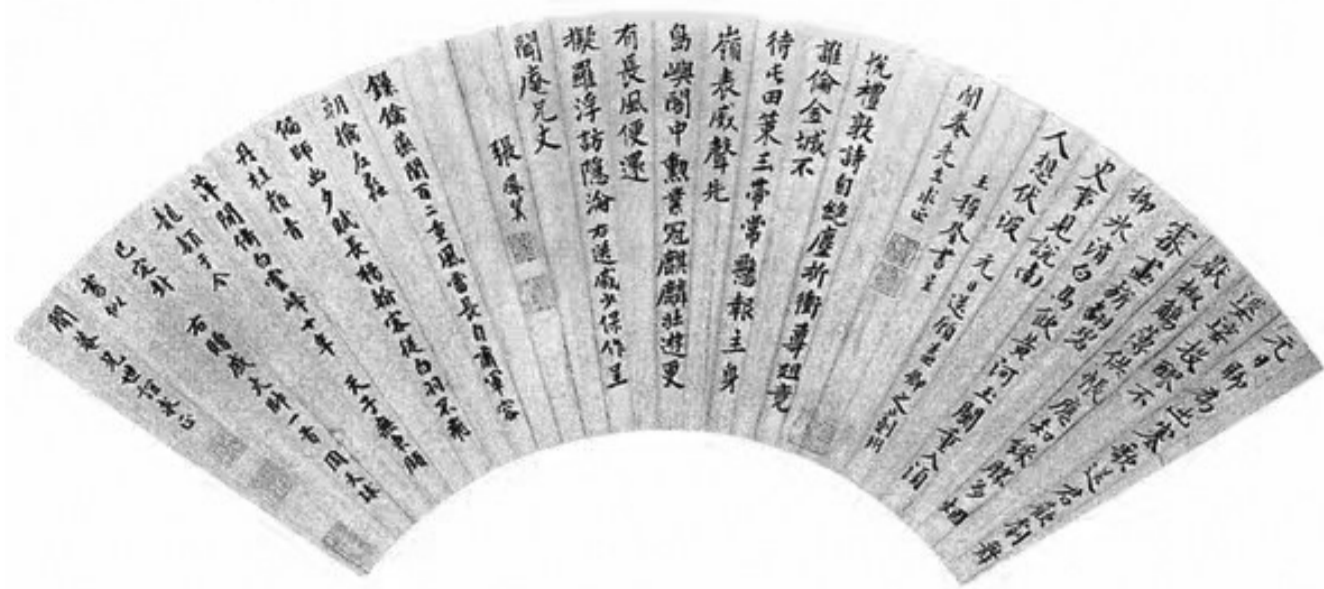
左图：故宫博物院藏王穉登、张凤翼、周天球合书扇。