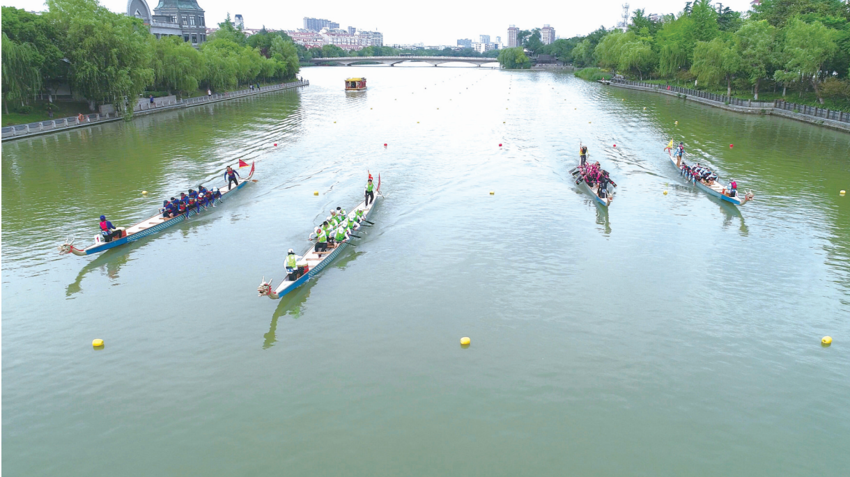
26日下午,市龙舟协会2022年第二轮龙舟联赛活动举行,来自我市的14支龙舟队伍和2支来自苏州的龙舟队伍,共同在濠河之上劈波斩浪,争相竞速。

下阶段,启东市退役军人事务局将以贴心的服务、有力的措施,持续抓好优待证申领、发放工作,切实把优待证发放工作做实做好,确保各项优待政策落实落细,进一步提升广大退役军人及其他优抚对象的幸福感、荣誉感。