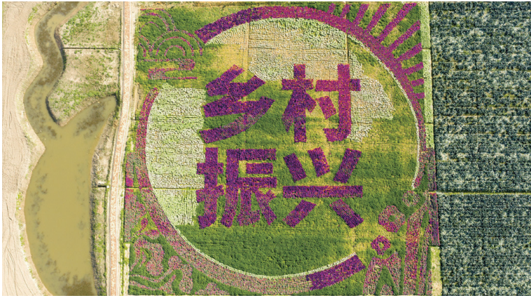
大豫菜田画