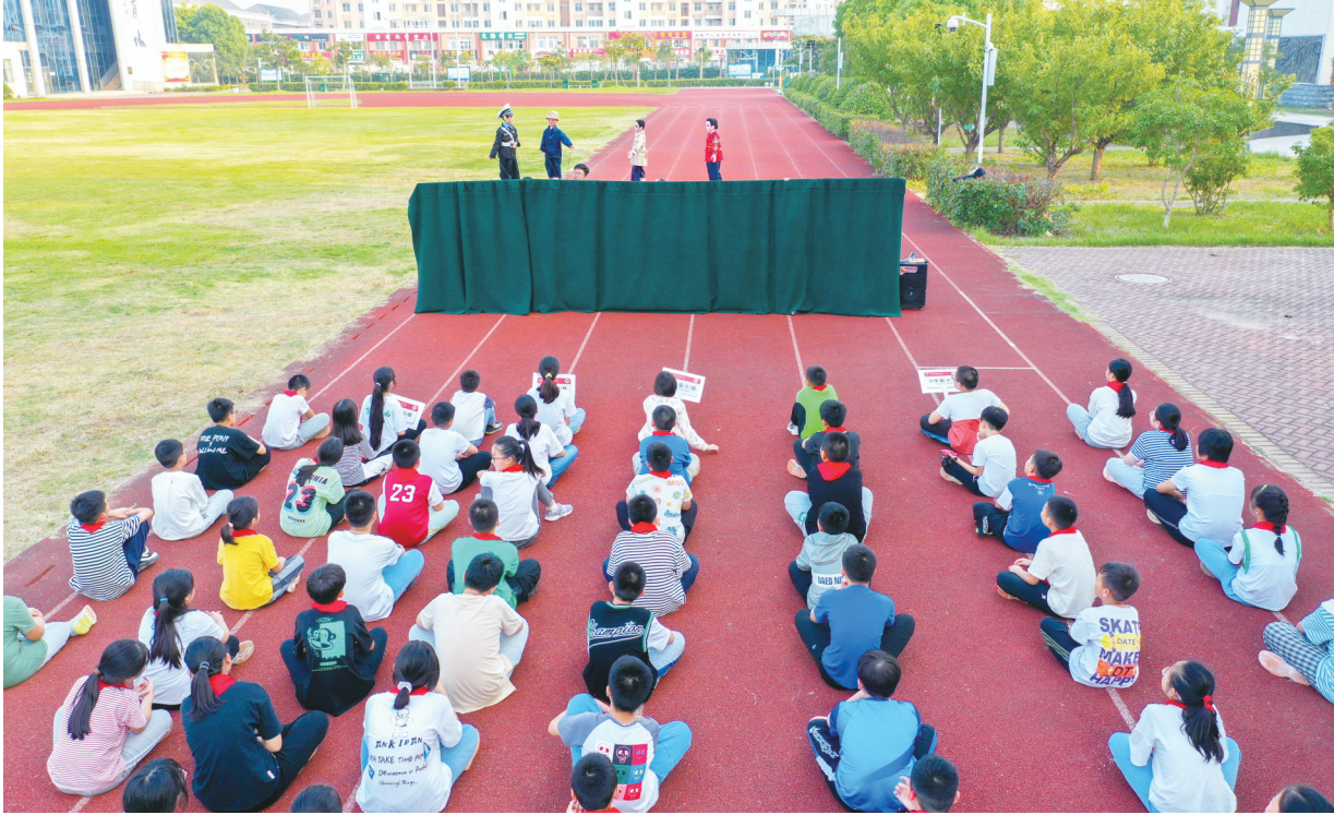
6日,如皋市如城小学学生观看木偶短剧表演《交通文明你我他》。当天,如城街道新时代文明实践所联合属地派出所、木偶艺术团等单位,走进如城小学开展“护苗·开学第一课”活动。