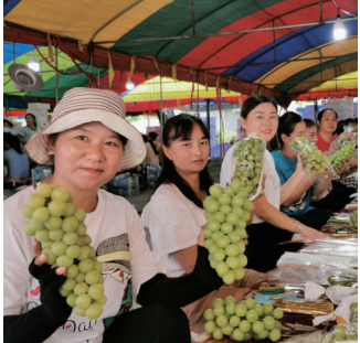
全国“一村一品”示范村掘港街道虹桥村四季采摘园阳光玫瑰葡萄销售火爆。