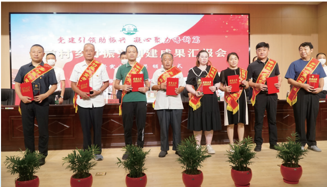
全国文明村——双甸镇高前村为乡贤颁发乡村振兴突出贡献奖。