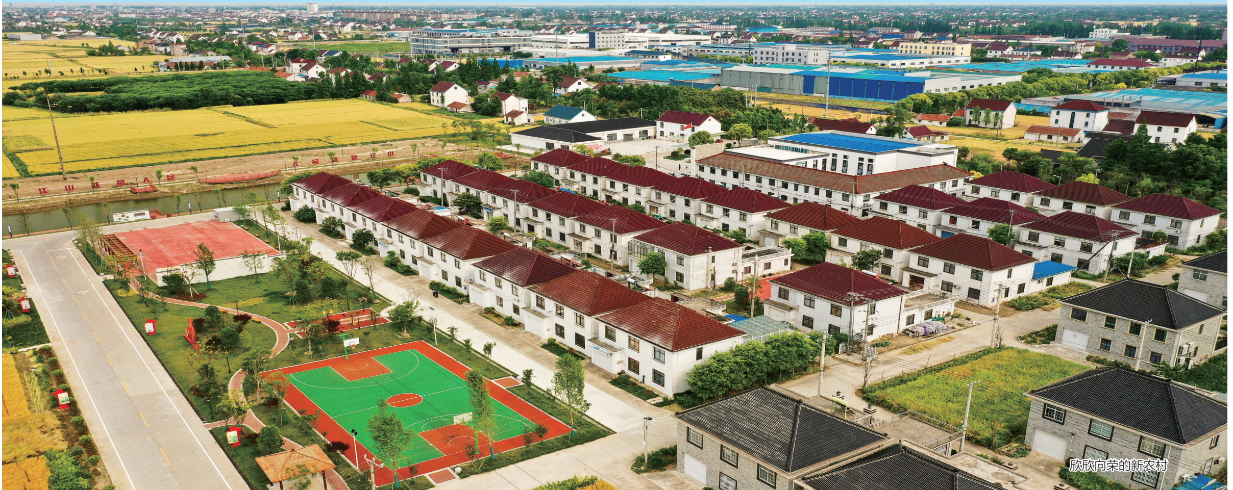
欣欣向荣的新农村