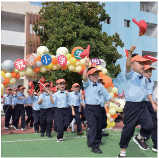
位于如东东片区的解放路小学投入使用。