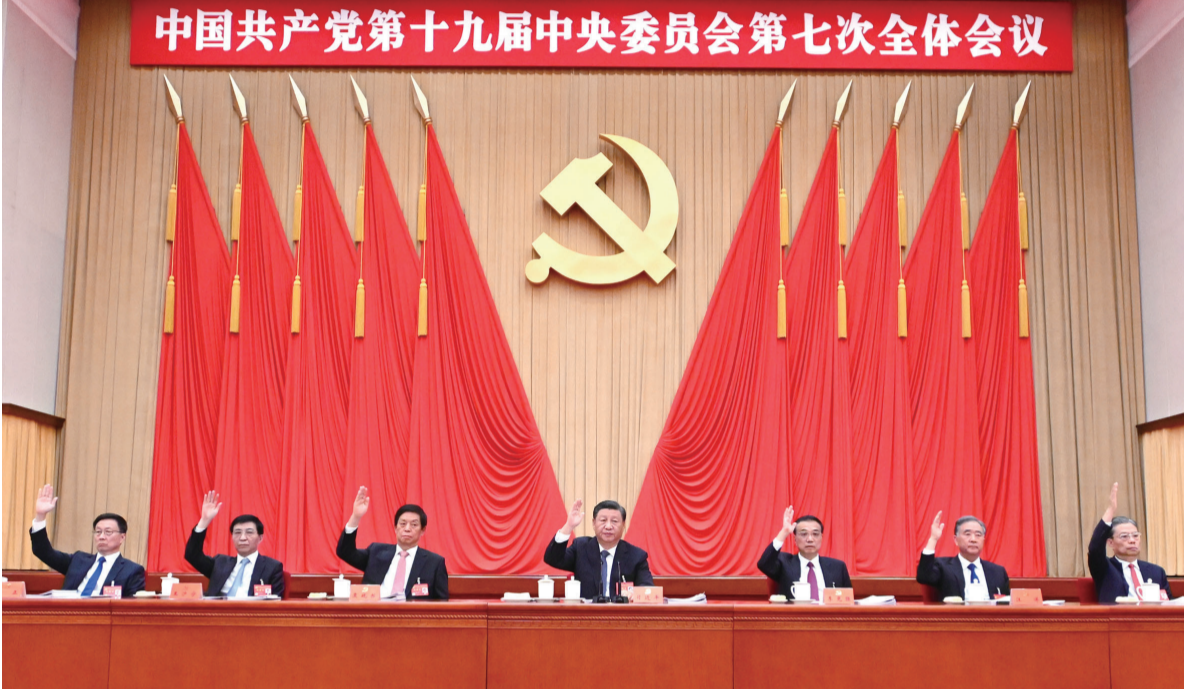
中国共产党第十九届中央委员会第七次全体会议,于2022年10月9日至12日在北京举行。这是习近平、李克强、栗战书、汪洋、王沪宁、赵乐际、韩正等在主席台上。

新华社北京10月12日电 中国共产党第十九届中央委员会第七次全体会议公报 (2022年10月12日中国共产党第十九届中央委员会第七次全体会议通过) 中国共产党第十九届中央委员会第七次全体会议,于2022年10月9日至12日在北京举行。 出席全会的有中央委员199人,候补中央委员159人。中央纪律检查委员会委员和有关负责同志列席会议。全会由中央政治局主持。中央委员会总书记习近平作了重要讲话。 全会决定,中国共产党第二十次全国代表大会于2022年10月16日在北京召开。 全会听取和讨论了习近平受中央政治局委托作的工作报告。全会讨论并通过了党的十九届中央委员会向中国共产党第二十次全国代表大会的报告,讨论并通过了《中国共产党章程(修正案)》,决定将这3份文件提请中国共产党第二十次全国代表大会审查和审议。习近平就党的十九届中央委员会向中国共产党第二十次全国代表大会的报告讨论稿向全会作了说明,王沪宁就《中国共产党章程(修正案)》讨论稿向全会作了说明。