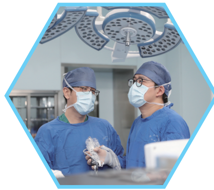
医院打造关键核心技术为患者解除病痛

我始终认为,医院技术是硬核、文化是柔术。我们的“六心”文化也是在医院111年发展中形成的,是我们全体员工遵守和奉行的价值观念、基本信念和行为准则。我们的核心文化是医院高质量发展的重要引领,是保障医院健康发展的动力源泉,是提升核心竞争力的有力抓手。