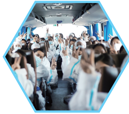
医院坚决打赢疫情防控的“五大战役”