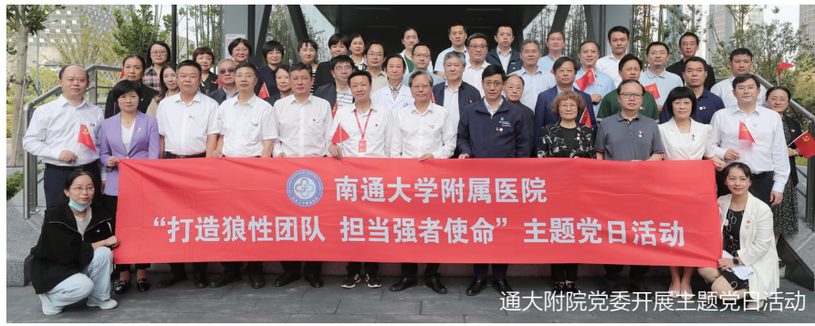
通大附院党委开展主题党日活动

记者:10月16日,中国共产党第二十次全国代表大会在北京隆重开幕。在这样一个特殊的日子,南通大学附属医院拿出了怎样的成绩单献礼盛会?这一成绩的取得对于广大江海百姓来说又意味着什么?