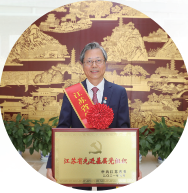
医院被授予“江苏省先进基层党组织”称号

记者:江海百姓都非常关心南通大学附属医院东院区建设进展情况,能否给大家就最新建设情况做一个介绍?