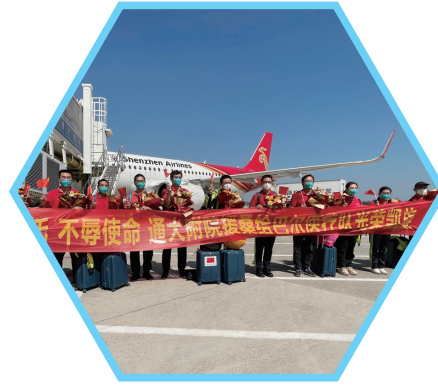
援桑给巴尔医疗队凯旋