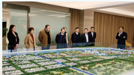
走访调研园区，推进“政银园投”业务

南京银行南通分行在服务企业过程中发现，信息不对称、渠道不通畅往往成为阻碍企业获得融资的关键问题之一。为此，该行突破传统思维，不求短期利益，以客户培育为重点，倾力打造“鑫未来”私享沙龙、江海英才创业英雄汇多方合作交流平台，为企业提供多层次、多维度的支持服务。