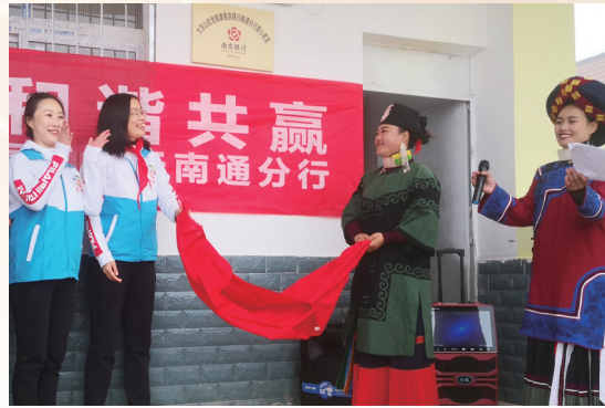
大凉山腹地援建爱心教室竣工挂牌

自启动“基层减负促实干，赋能增效强作风”专项行动以来，该行通过走访调研、发放问卷等方式，查摆问题、解决问题、强化作风，切实为基层经营单位减轻负担，“放手”干出企业和群众满意的“最优服务”，激发干部员工在新时代担当初心使命的思想自觉、政治自觉和行动自觉，凝聚起共谋发展、团结进取的自驱动力。