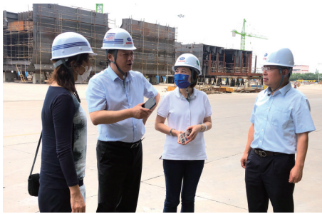
实地走访企业，了解融资需求

京银行南通分行深耕当地市场、倾情支持实体经济的一个缩影。该行以深耕地方经济、服务实体经济为重点，加大专业提升、产品运用、机制建设等，推出“鑫转贷”“鑫人才”“鑫知贷”“鑫科保”“鑫e高企”等产品，正构建满足企业全生命周期需求的金融产品支持矩阵，一路陪伴支持诸多企业由小到大、由大到强，实现了银企共同发展。