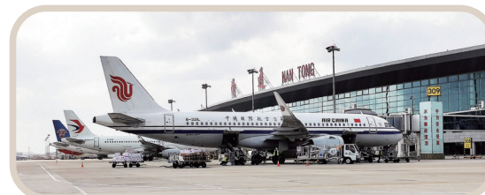
中国国际航空、中国东方航空、中国南方航空“三大航”同时停靠南通机场停机坪。