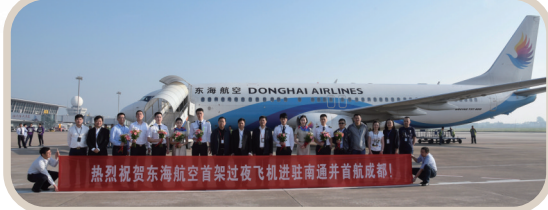
2017年，东海航空、深圳航空飞机相继驻场，过夜飞机实现零的突破。