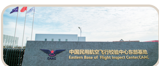
2021年12月28日，中国民用航空飞行校验中心东部基地投入运行，南通成为校飞中心“一总部四基地”重要组成部分。