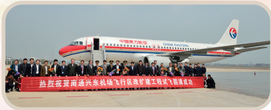
2012年，飞行区改扩建工程试飞成功，全面进入3400米跑道新时代。

征程万里风正劲，重任千钧再出发。南通机场将以习近平新时代中国特色社会主义思想为引领，认真学习贯彻落实党的二十大精神，朝着现机场高质量发展，新机场高起点建设的“两高”发展目标，从“上海国际航空枢纽辅助机场”向着“上海国际航空枢纽重要组成部分”昂首迈进，奋力走好新时代的“赶考之路”。 ·徐菲·