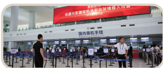
2019年8月18日，5.2万平方米新航站楼投入启用。