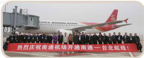
2015年，国务院正式下发《关于同意江苏南通兴东机场对外开放的批复》，南通机场口岸实现“当年批复、当年验收、当年通航”。当年，旅客吞吐量首次突破100万人次，迈入全国中型机场行列。