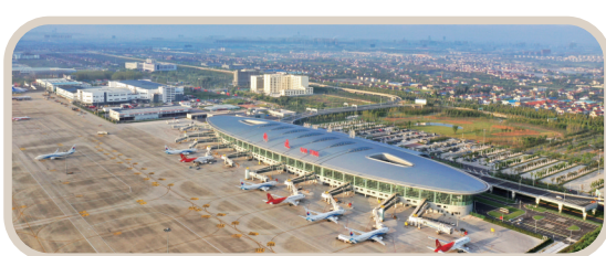
“十二五”以来，南通机场合作机遇增多，产业链不断延伸。顺丰速运区域分拨中心、京东物流全球航空枢纽、中国民航飞行校验中心东部基地等项目相继落户建成。