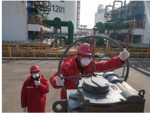
“疫”路保供,江苏LNG接收站党员突击队坚守岗位。