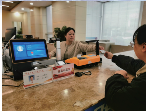
洋口港经济开发区行政审批党员示范岗,服务群众零距离。

机制、人才资源引进服务机制、惠企政策快捷通道、诚信企业差异化监管机制、严格规范公正文明执法机制,实现服务“0”障碍……今年,洋口港经济开发区党工委把打造最优营商环境作为党建的重要内容,推出服务企业“360计划”,总投资23.9亿元的九州星际项目,吃上审批“前延”服务的套餐,提前把业主和建设、监理单位召集到一起布置审批“作业”,现场办公、即时打通堵点,下发提供材料清单,面对面辅导,指导网上提交,实现项目报建“零等待”“跑一次”。