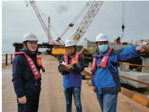
承担黄海二桥施工的中交二航局项目部班子成员,每天一线跟班,巡查巡检。