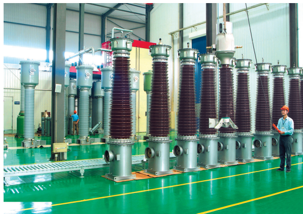
江苏思源赫兹互感器有限公司畅销国际市场。