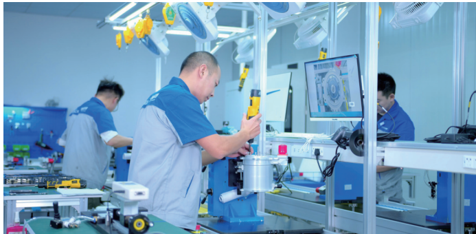
势加透博洁净动力如皋有限公司订单爆满,工人赶制保交期。

在全钢丝载重子午线轮胎、全钢丝子午线工程轮胎的基础上,双钱集团(江苏)轮胎有限公司开发的环保节能型低滚动阻力绿色轮胎,捧回省科学技术二等奖,带来产销两旺。今年1到9月,实现应税销售24亿元,同比增长14%。