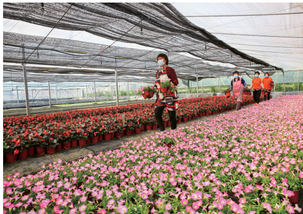
花园桥村花卉产业红似火。