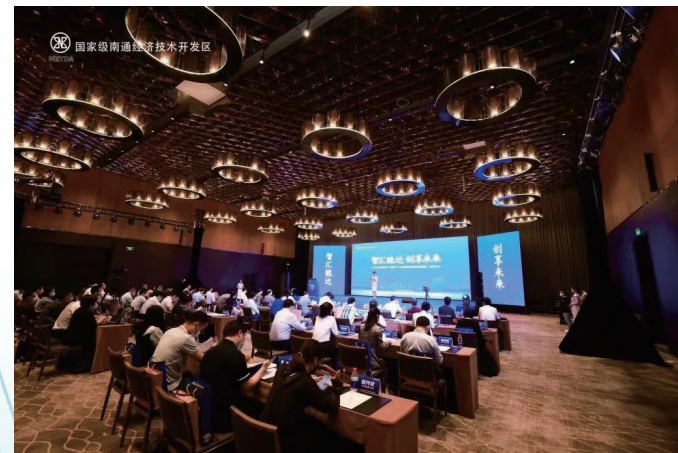
“能达杯”人才科创城市路演