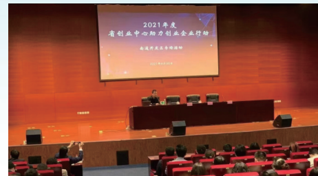
人才科创平台载体申报培训