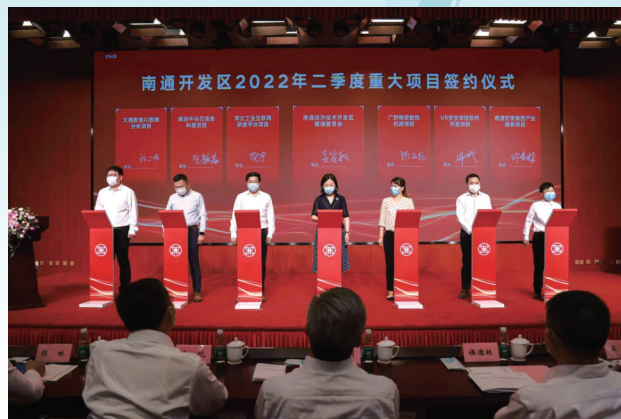
科创项目集中签约