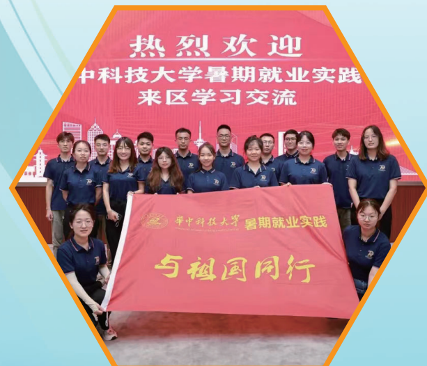
青年人才来区学习交流