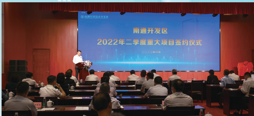
重大项目签约集聚人才科创资源