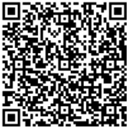
扫二维码可阅读全文

三十年只是历史长河的一瞬间,却是南通历史上浓墨重彩的一页。默默无闻的传统小县蜕变为“近代第一城”“中国模范县”“民族工业的重要发祥地”,被来访的友人誉为“中国的乐土”“江北一带之首都”。