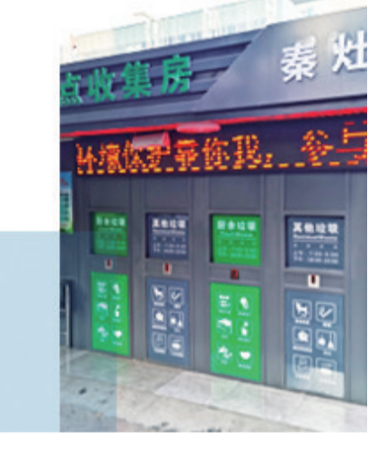
▲近日,任港街道晨苑社区居民正在投递分类垃圾。

▼自去年4月投用以来,秦灶街道桂花园小区垃圾分类日均运送居民生活垃圾80余桶。