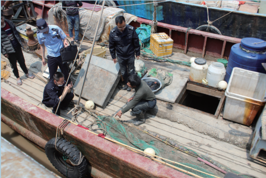
长航南通公安启东派出所联合渔政部门破获一起非法捕捞水产品案件，对涉案渔获物及渔船进行查扣。