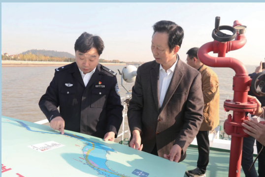
江苏长江经济带研究院院长长春院长带队调研长江南通段水域。

党的二十大报告指出，“提升生态系统多样性、稳定性、持续性”“实施好长江十年禁渔”。长江禁渔，保护的不仅是鱼，更重要的是修复长江流域生态环境。在长江大保护的背景下，长航南通公安深刻认识“长江禁渔”的长期性、复杂性和艰巨性，以“十年磨一剑”的坚持，以“零容忍打击”的态度，坚决压降遏制非法捕捞犯罪态势，让水清江阔凭鱼跃的生动画面，成为南通水生态环境修复和水生生物多样性保护的鲜明注脚，以“南通之为”贡献“长江之治”，以“长江之治”推动人与自然和谐共生的中国式现代化展现出可见可感可触的现实图景。