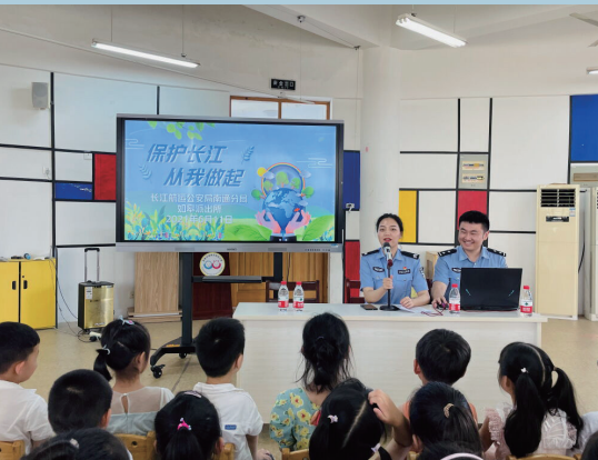
长航南通公安如皋派出所民警到辖区幼儿园开展长江大保护宣传活动。

同时，长航南通公安深入推进“谁执法、谁普法”责任制落实，大力弘扬社会主义法治精神，开辟沿江“进码头、进船舶、进企业、进学校”的“四进”宣传阵地，广泛开展《长江保护法》宣贯教育，推动习近平法治思想深入人心，使尊法学法守法用法在长江南通段蔚然成风，为平安长江、法治长江建设贡献更多长航公安力量。