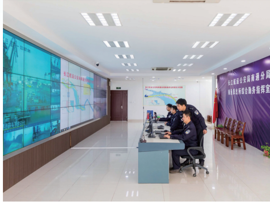
民警通过视频监控巡查沿江岸线，织密立体化巡防网络。