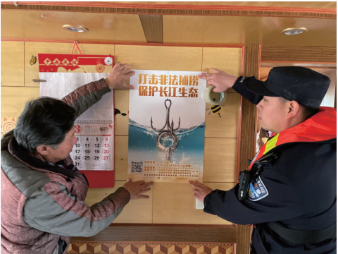
长航南通公安民警向船民开展长江大保护法制宣传。

长航南通公安与江苏省重点高端智库江苏长江经济带研究院建立协同研究与战略合作，积极参与长江保护法实施学术研讨会，以《长江大保护中的公安执法实践与思考——基