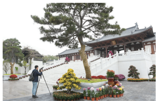
14日媒体记者在南宋德寿宫遗址博物馆正门拍摄。

据新华社电 位于浙江杭州的德寿宫遗址是南宋临安城内一处重要的宫苑遗址,曾有宋高宗、宋孝宗等在此居住,宫殿与园林并置,是江南园林的集大成者。1984年德寿宫遗址首次被发现,先后经历四次较大规模的考古发掘。2020年12月,德寿宫遗址博物馆建设正式开工,依托考古遗址,采取了室内展示展陈、数字化展示、遗址模拟展示等手段,系统展示南宋历史文化全貌。历经近两年的修建,德寿宫遗址博物馆将在今年11月中下旬对公众开放。