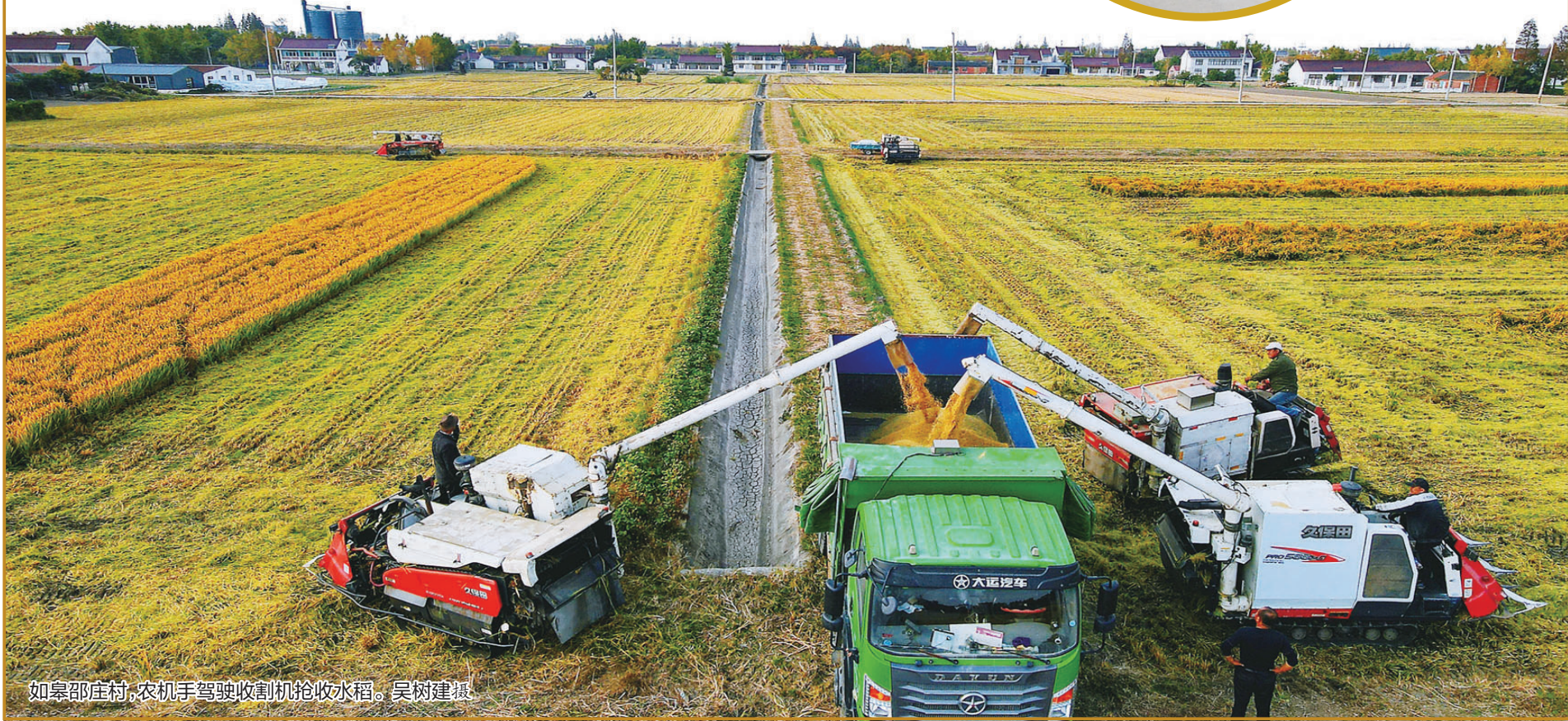
如皋邵庄村,农机手驾驶收割机抢收水稻。