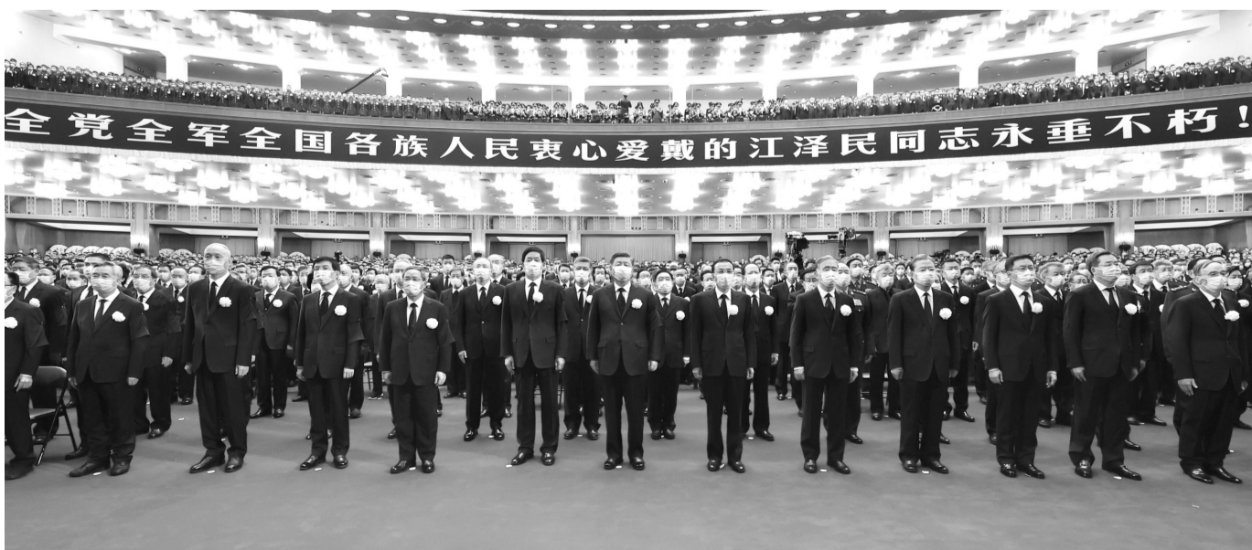
12月6日，中共中央、全国人大常委会、国务院、全国政协、中央军委在北京人民大会堂隆重举行江泽民同志追悼大会。习近平、李克强、栗战书、汪洋、李强、赵乐际、王沪宁、韩正、蔡奇、丁薛祥、李希、王岐山等参加大会。新华社记者 鞠鹏摄