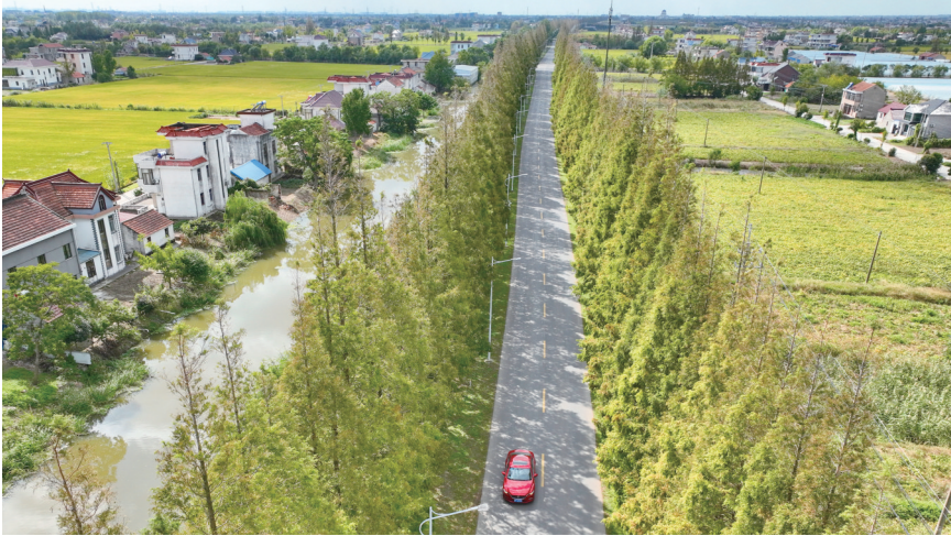
十总镇农路海五线

通州借助大数据、智慧农路等平台，探索出“路联管、路全管、路共管、路常管”的农村公路管理的新路子，实行一月