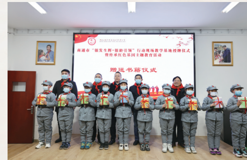
“银发生辉·银龄引领”行动现场教学基地揭牌仪式暨传承红色基因主题教育活动

晴”小老人帮扶老年人志愿服务项目获评全国学雷锋志愿服务先进典型。此外,持续深化“立德树人”行动,组织580余名老干部宣讲骨干开展线上线下宣讲790场,与市委宣传部等联办“我们的节日·重阳”线上主题文化活动,“老心向党 喜迎二十大”老少同台节目展演,在市老干部活动中心成立“南通市关心下一代教育基地”,南通市“银发生辉·银龄引领”行动首个现场教学基地在如皋红军小学揭牌。选树全市“最美老干部”系列典型,集中展示22名“最美志愿者”、10个“最美团队”和16个“最佳项目”风采,持续放大激励示范效应,为新时期南通高质量发展凝心聚力。