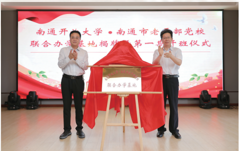
老干部党校联合办学基地揭牌

“举办风采展示活动,就是要充分展现40年来全市老干部工作的丰硕成果,更好赓续老干部工作的优良传统,积极推动我市老干部工作在开拓创新、在创新中发展,不断在新的起点上实现新突破、续写新荣光。”在9月21日喜迎党的二十大暨纪念干部离退休制度建立40周年全市老干部和老干部工作者风采展示活动上,市委常委、组织部部长封春晴表示。