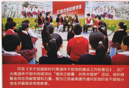
工作成果入选中宣部“奋进新时代”主题成就展