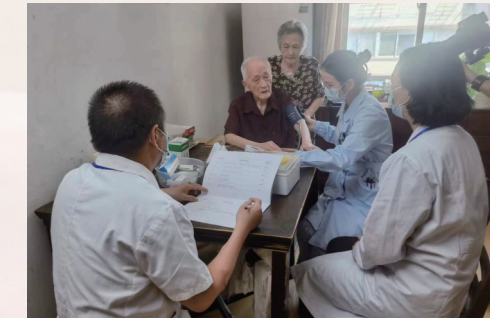
组织家庭医生上门服务为离休干部服务

动”,日常推出5类12个精准“暖心项目”,为老同志提供个性化服务。成立市老干部党校、开放大学联合办学基地,开设6个专业、13个教学班,此外,开设线上线下乐龄课堂,开展书画摄影展等丰富多彩的活动,帮助老同志实现有作为、有进步、有快乐的乐龄生活。上月,我市还出台《关于进一步加强老干部活动学习阵地工作的实施意见》,组织参加全省示范性活动学习阵地创建,市老干部活动中心成功创建南通市第四届“敬老文明号”。