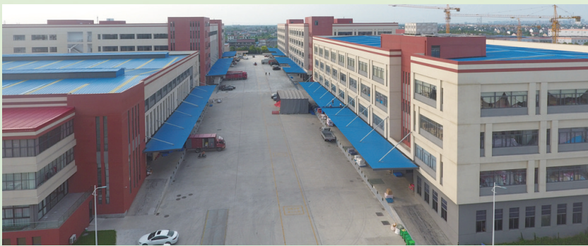
如东县农业大数据电商智能化项目

据统计,40个农业产业园,有入园企业351家,适度规模经营占比64.3%,农产品产后处理率达83%,农产品电商销售率为12.1%。园区产业发展培训农民22.84万人次,辐射面积达259.84万亩,形成现代农业的产业体系、生产体系和经营体系,提高了农业创新力、竞争力和全要素生产率,实现农村一二三产业深度融合发展。