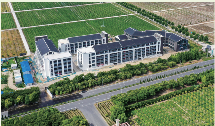
海安市蚕种科研与繁育中心项目

“强国必先强农,农强方能国强。”上月底,中央农村工作会议,擘画了推进农业农村现代化,加快建设农业强国的路线图。