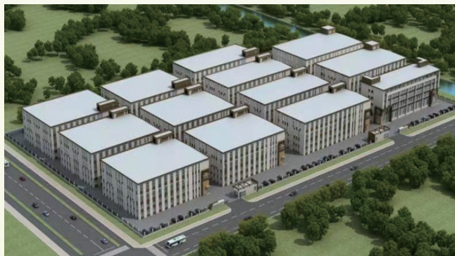
海门区秋漾食品科技项目效果图

省级农业现代化先行区海门,构建“中心+专业化区域分中心+田头基地”三级冷链物流体系,打通鲜活农产品出村进城“最后一公里”,基本形成了“基地生产+净菜加工+保鲜冷藏+冷链物流”的全产业链模式。百卡弗、强盛、苏洪、京海等农业龙头企业为载体,建立“蔬果+海门山羊(海门黄鸡)+肥料还田”的生态循环农业模式,累计新建设施大棚1.18万亩,推广应用微喷滴灌、肥水一体化技术2.1万亩,高效设施农业面积3.42万亩,耕种收先进农机装备1.5万多台(套),园艺作物机械化水平达70.6%。