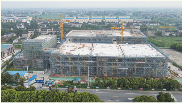
如皋市拓丰健康食品项目(在建)