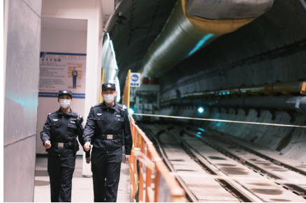
长航南通公安海门派出所民警在中俄东线天然气管道施工现场巡逻

南通好通,万事好通。长航南通公安通过靠前保障海太长江隧道、张靖皋长江大桥、北沿江高铁等重大项目施工建设,开展打击涉企犯罪专项行动,推动