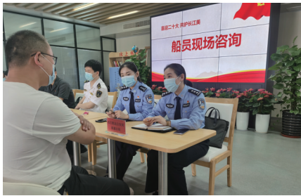
长航南通公安民警在船员法律咨询会现场

长航南通公安水域治理创新举措还有许多——通过全力参与社会治安防控体系建设“示范城市”创建活动,以全方位、立体化、智能化为导向,长航南通公安有力增强水域治安防控的整体性、协同性、精准性;持续完善“长江大保护”法治协同体系,会