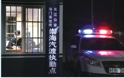
长航南通公安民警夜间值守汽渡执勤点

热血铸警魂,忠诚保平安。长航南通公安启动战时加强勤务机制,落实领导班子双带班和日点调工作制度,围绕影响国家政治安全和社会稳定的各类涉江风险