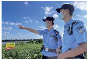
长航南通公安民警在涉水风险区域开展巡逻

由长航公安南通分局、南通海事局在长江如皋段共同举办的“2022年度长江干线南通段水域反恐处突综合联合演习”,综合检验现代警务应对水域暴恐袭击时的应对能力,确保快速有效处置各类暴恐袭击和公共突发事件。