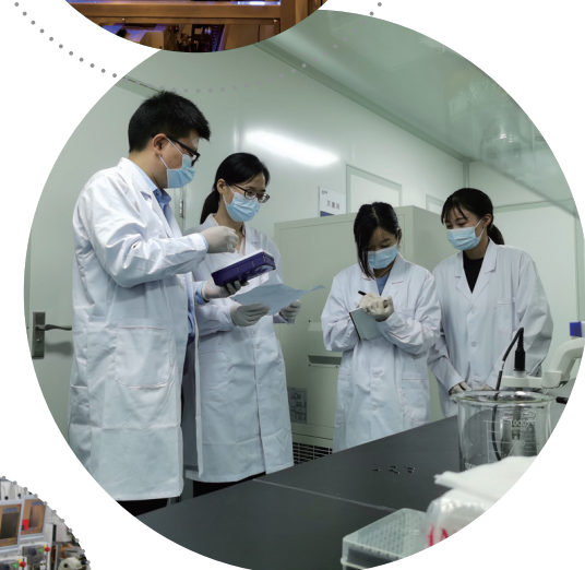
江苏博嘉生物医药科技有限公司实验室