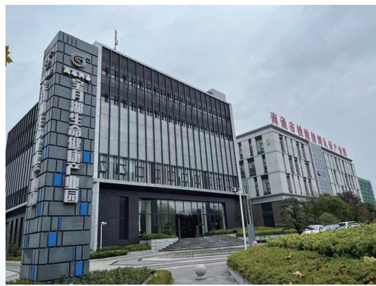
宝月湖生命健康产业园