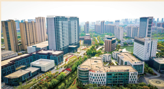
如皋软件园注入创新活力

如皋的经济韧性与纾困力度给足了企业在高质量发展道路上奔跑的底气。过去的一年,新增制造业贷款46亿元、普惠型小微企业贷款增量南通第一,新增各类市场主体2万多户,市场主体的“稳”有力保障了经济发展的“进”。