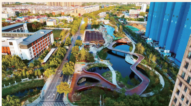
宏坝河特色景观工程

隆冬时节,宏坝河特色景观工程也已接近尾声,三三两两的行人在沿河步道上散步,几只水鸟在清澈的水面上自在觅食。