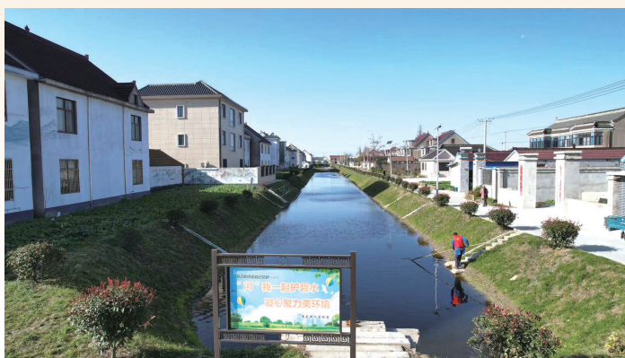
河道整治长效管护