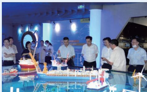
分行党委调研中远船务