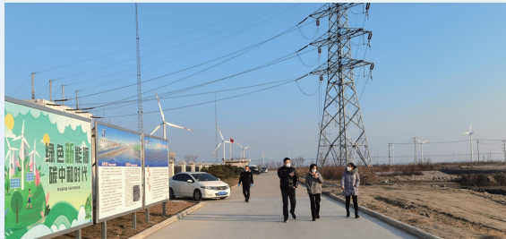
客户经理实地考察、评估如东风电项目

战略性新兴产业是促进经济高质量发展的重要引擎，也是银行金融机构服务实体经济、调整信贷结构的重要抓手。建行南通分行始终坚持科技赋能，持续深化金融创新，优化服务模式，集中信贷资源，及时满足企业融资需求，为战略性新兴产业发展提供有力的金融支持。