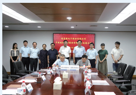
南通分行与通富微电签约战略合作协议

制造业企业贷款需求量大、用款周期长，建行南通分行结合企业资金需求特点，在风险可控前提下为企业“智造”提供更多中长期贷款，护航高端制造企业高质量发展。2022年6月，建行南通分行与通富微电签署了全面战略合作协议，双方站上强强联手、互惠合作的新起点，建行南通分行表示，将进一步发掘、利用各自领域优势，实现资源共享、优势互补，全力营造战略性新兴产业蓬勃发展新生态。