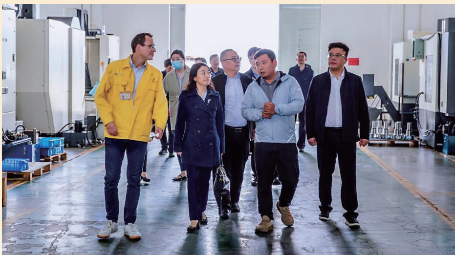
调研摩多利传动机械制造有限公司

近年来,人民银行推出一系列结构性货币政策工具,全力支持地方实体经济高质量发展。2022年1至11月,南通人行累计向南通地区投放央行再贷款再贴现资金297亿元,列全省第四位;推动人民银行总行六类阶段性专项政策资金在南通落地70亿元,惠及市场主体、项目167个,平均融资利率低至3.79%,其中“碳减排”“普惠养老”“设备更新改造”等专项资金投放全省领先。