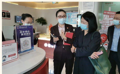
指导南通招行反诈工作