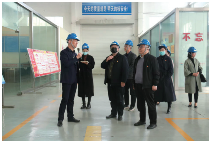
调研神通阀门股份有限公司