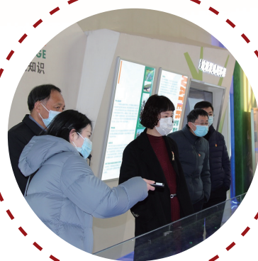
赴天楹集团了解金融支持情况