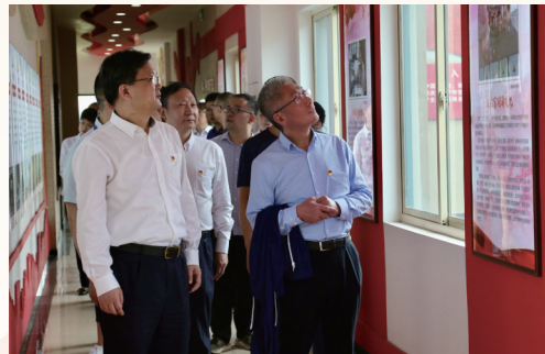
与南通工行开展联学联建