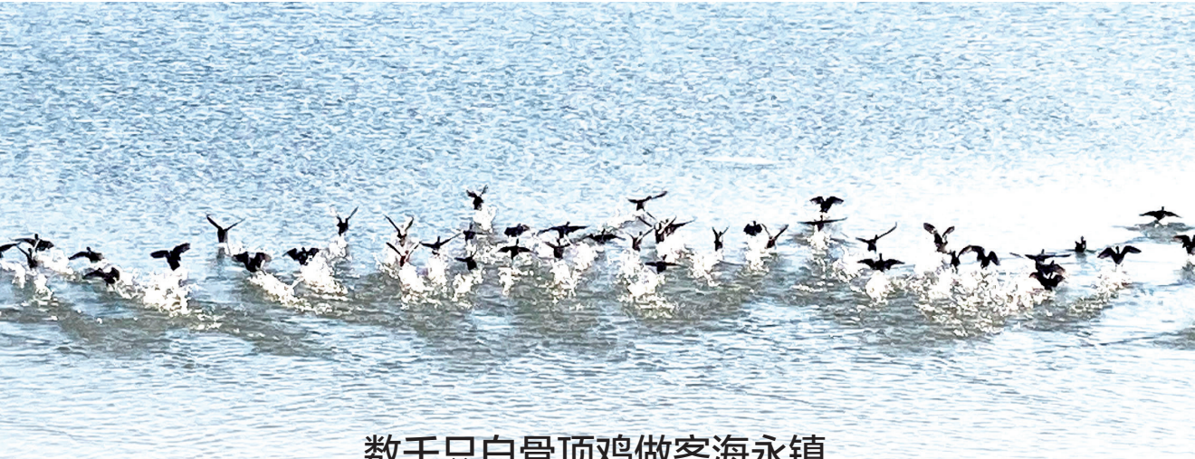
数千只白骨顶鸡做客海永镇

民警先后来到联钢精密科技(中国)有限公司、捷捷半导体有限公司等企业，详细了解安全生产管理工作情况，实地查看生产车间、值班室、监控室、消防器材等，对安全生产管理制度、视频监控、消防器材等进行详细检查，要求企业安保负责人高度重视各项安全生产工作，坚决守好安全生产底线，认真做好值守巡查工作，严防各类安全事故发生。