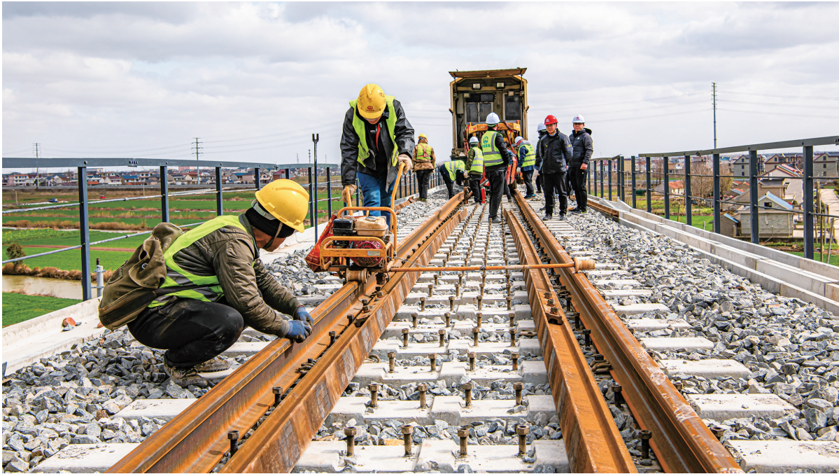
12日,洋吕铁路三甲特大桥首对500米长轨接头焊接成功,标志着洋吕铁路工程1标主线启东段进入焊轨阶段。

为帮助服务外包企业做优做强,此次申报对企业服务外包执行额、从业人数、税收贡献三个主要维度进行综合考评,分种子型、骨干型(成长型)、龙头型三个类型进行奖励。种子型总分前三名,分别给予10万元、8万元、6万元奖励;骨干型(成长型)总分前三名,分别给予30万元、25万元、20万元奖励;龙头型总分前三名,分别给予60万元、50万元、40万元奖励。