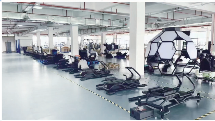
赋助智能科技有限公司

“边原满天星”民族文化、“本茶纲目”茶文化游戏……在刚刚举办的2023年南通数字文化产业(上海)推介会上,20个项目签约崇川,为该区数字文化产业发展再添“新助力”。 现代服务业是主城崇川重点布局的产业。抢抓数字经济发展新机遇,该区把数字文化作为发展现代服务业的重要抓手,聚焦直播电商、动漫游戏、电子竞技、数字装备、数字影视五大重点方向,规划建设“一主四副”数字文化产业集群,成立南通市首个数字文化产业园。去年,全区新增规上数字文化企业39家,创历年新高,9个数字文化产业园项目成功入选市文化产业重点项目。 起步即开局。今年,崇川区政府、南通市数字文化产业园同步发布数字文化产业专项扶持政策,倾力构建产业发展良好生态,朝着打造长三角数字文化产业发展新高地阔步迈进。