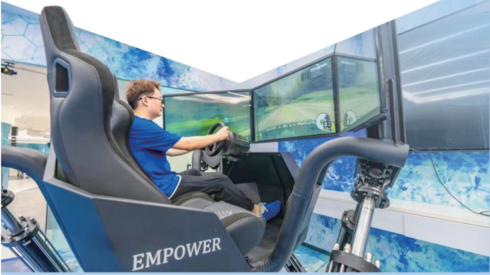
市民体验VR驾驶模拟器