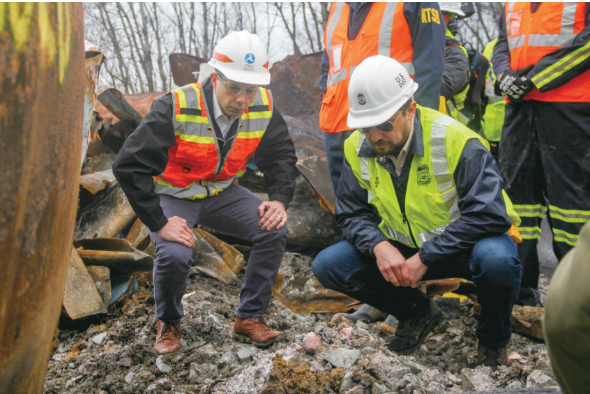
当地时间23日，美国交通部长访问俄亥俄州“毒列车”事故发生地。

美国“毒列车”脱轨事故发生已有三周，由其造成的恶劣后果日益显现。针对美国政府受到的反应迟缓、应对不力批评，总统约瑟夫·拜登2月24日表示，会派人上门了解情况，但他本人不打算前往事故现场。 拜登要求美国疾病控制和预防中心、环境保护局、联邦紧急事务管理署派