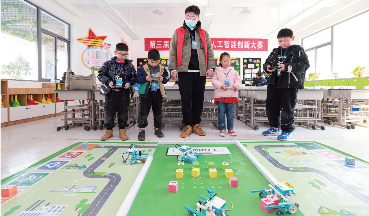
26日，南通开发区实验小学教育集团龙腾校区，学生在比赛中。当天，由市科学技术协会、市教育局主办的第三届南通市青少年人工智能创新大赛——智能车挑战赛、机器人任务挑战赛在南通开发区实验小学教育集团龙腾校区举行，来自全市各小学和幼儿园的600多名选手参赛。

市生态环境局苏锡通园区分局相关负责人介绍，在前期对辖区内所有使用活性炭吸附设施的工业企业进行全面排查后发现，部分企业在活性炭使用中存在以次充好、购买使用低碘值劣质活性炭、炭箱未规范填充、填充夹层过小等问题，不利于环境质量持续改善。举办此次培训会，旨在帮助企业管理人员增加环保管理知识储备，提高业务能力，进一步规范企业活性炭治理设施的使用及管理。