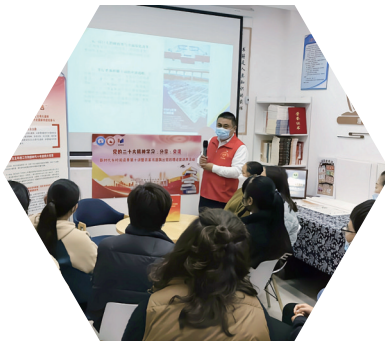
石港镇渔湾社区进行理论宣讲

通州还深化典型培育,发布年度10大志愿服务项目,每年评选出全区优秀志愿服务项目和学雷锋优秀志愿服务典型;承办南通市志愿服务大接力活动,实施志愿服务