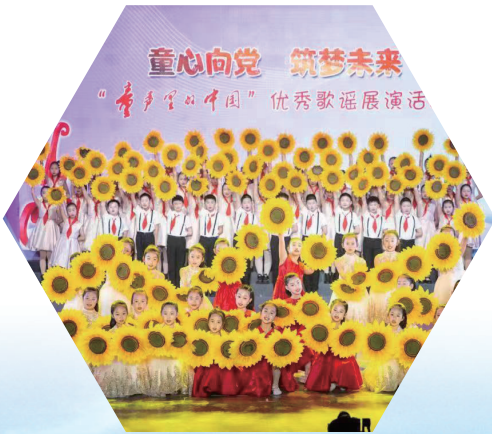
通州区“童声里的中国”文艺志愿服务队组织开展优秀歌谣展演活动

上百个志愿服务组织常态化开展扶贫助困、疫情防控、移风易俗、文明创建、科技科普等项目,“学雷锋”行动落到实处,“把有限的生命,投入到无限的为人民服务之中去”的无私奉献精神不断涌现。