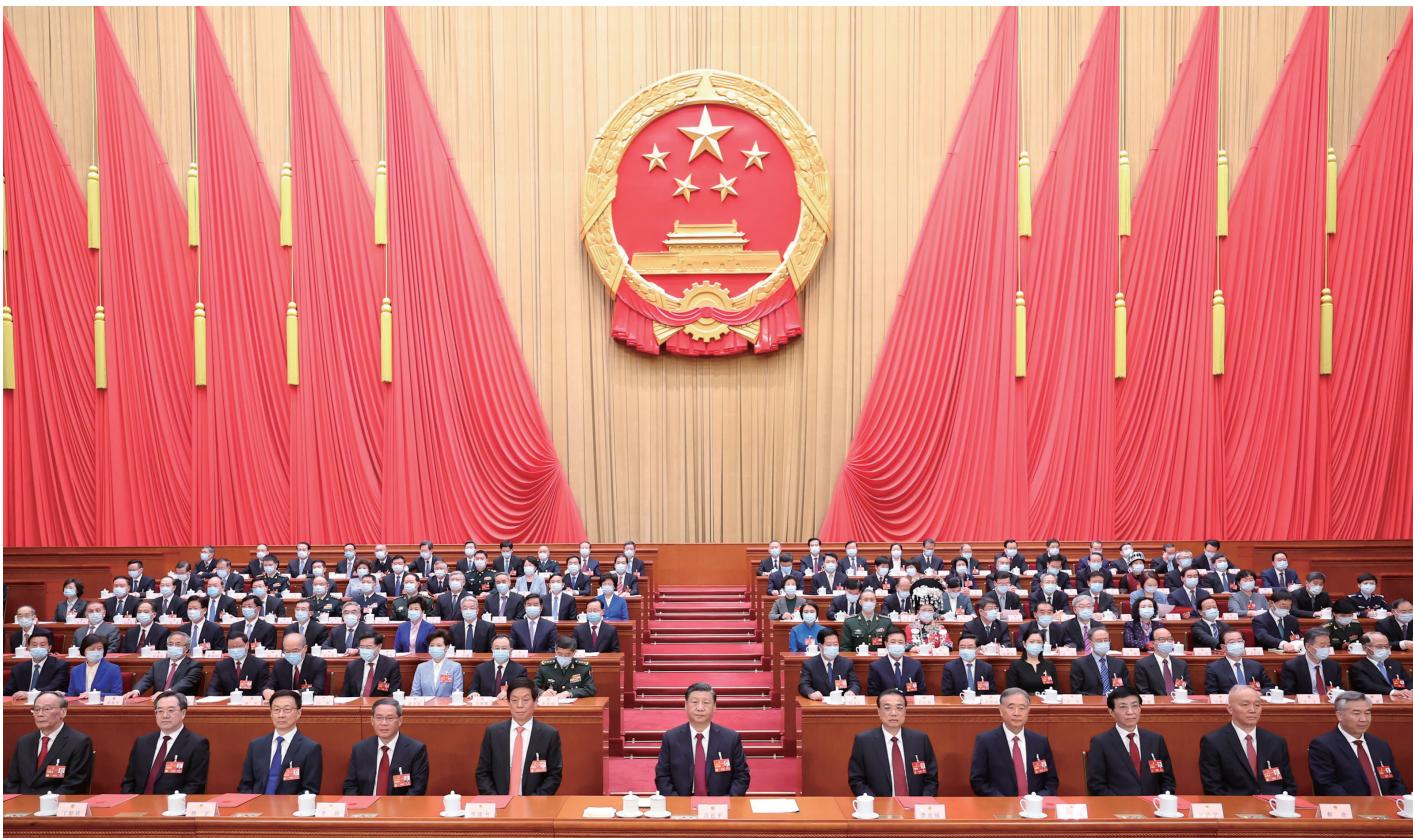
3月13日，第十四届全国人民代表大会第一次会议在北京人民大会堂举行闭幕会。

新华社北京3月13日电 中华人民共和国第十四届全国人民代表大会第一次会议，在圆满完成各项议程，产生新一届国家机构组成人员后，13日上午在北京人民大会堂闭幕。