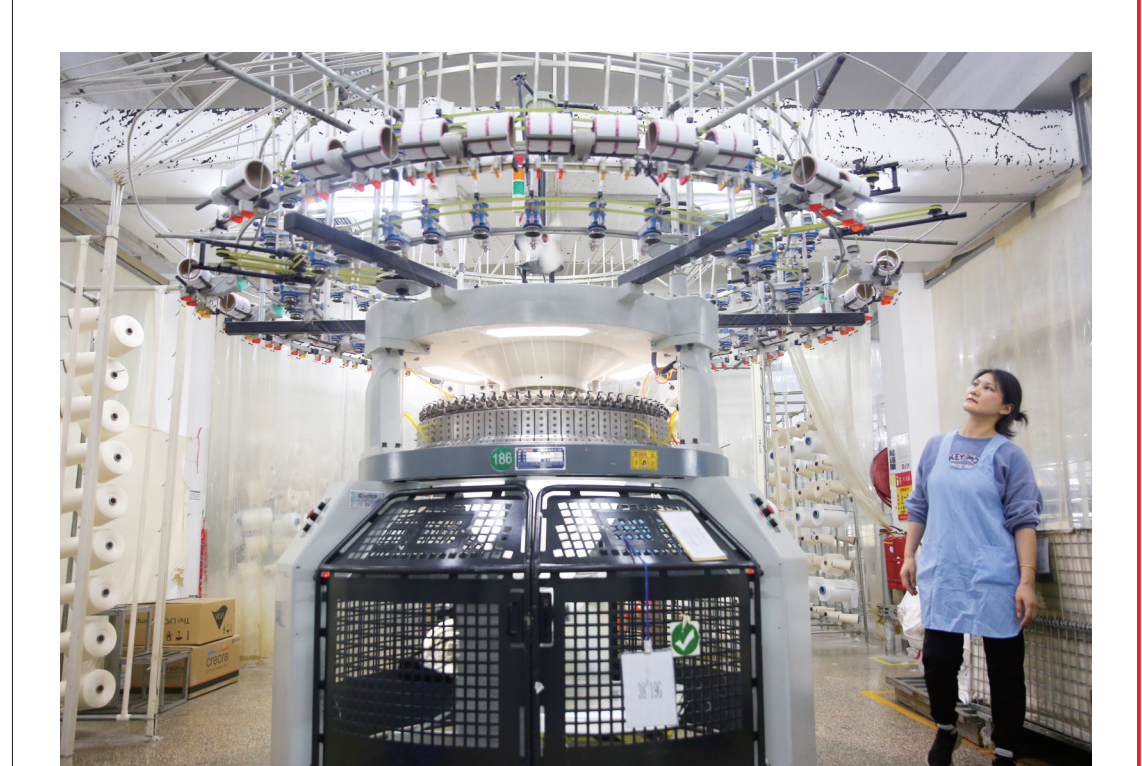
昨日，位于如皋的江苏泰慕士针纺科技股份有限公司内，工人正在忙着加紧生产国内外订单。近年来，公司立足传统产业转型升级，持续加大自动化、智能化设备投入力度，提高产品国际竞争力，推动企业高质量发展。

台，构建立体式学习方法，有力激发学习热情，为推动高质量发展奠定思想基础。同时，狠抓支部规范化标准化建设，创新实行支部工作清单化管理，落实季度督查、半年度“回头看”的考核制度和定期观摩交流机制，坚持“抓两头、带中间”，促进均衡发展，打造战斗堡垒。