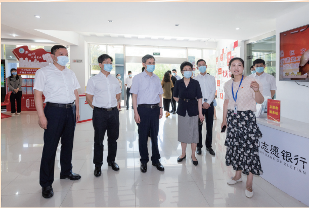
省委常委、统战部部长惠建林调研南通统战工作