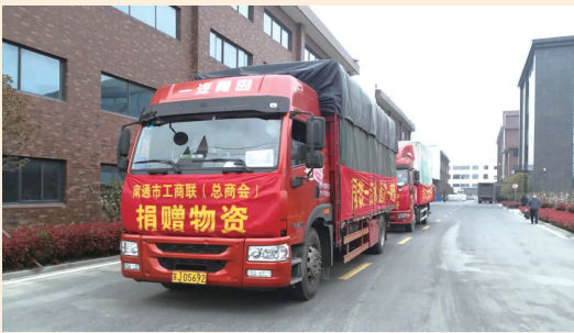
南通市工商联组织捐赠生活物资驰援上海