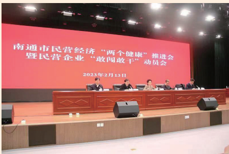
全市民营经济“两个健康”推进会暨民营企业“敢闯敢干”动员会召开