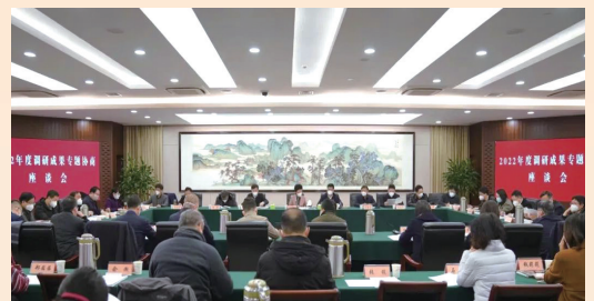
调研成果专题协商座谈会

立70周年、建党100周年等重要时间点,组织开展文艺汇演、座谈交流等活动,团结带领广大统战对象听党话、跟党走。聚焦打赢疫情“阻击战”,组织广大统战成员参与抗疫,市民主党派医卫界成员积极参加救治,民营企业和侨胞侨企累计捐款超两亿元,捐赠口罩700多万只,防护服3万多套。积极参与脱贫攻坚,通过产业合作、助学助医等方式引导民主党派、民营企业等统战成员助力脱贫攻坚,近5年投资光彩项目30余个,实现就业1.7万人,捐建光彩学校20余所,参与公益慈善项目近300个,捐款捐物超6亿元。