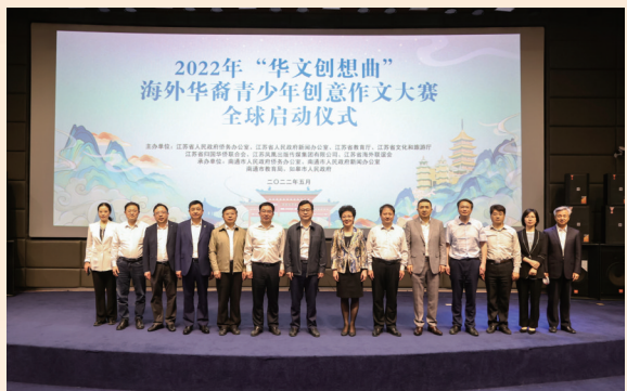
“华文创想曲”海外华裔青少年创意作文大赛全球启动仪式