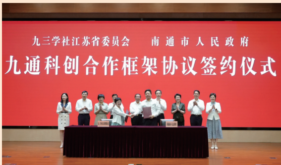
九三学社江苏省委与南通市人民政府签订“九通科创合作”框架协议

全市统一战线始终紧扣凝聚人心这个根本,突出思想政治引领这条主线,正确处理一致性 and 多样性的关系,努力推动统一战线各领域工作提质增效。