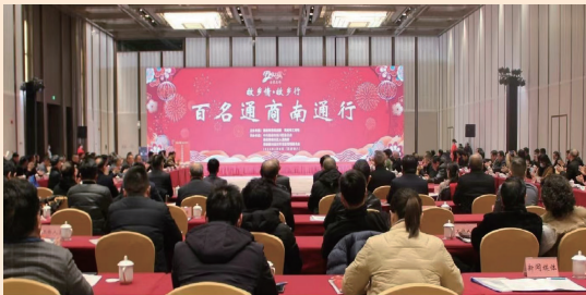
“故乡情 故乡行”百名通商南通行活动

党的中心工作推进到哪里,统战工作就跟到哪里。五年来,南通统一战线坚持把服务中心大局和统一战线所长相结合。全市统一战线紧紧围绕中央和省、市委各项部署要求,积极作为、主动担当,为全市高质量发展作出统战贡献。