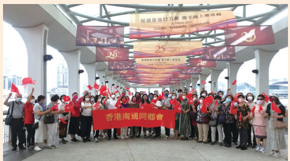
香港南通同乡会举行合唱活动