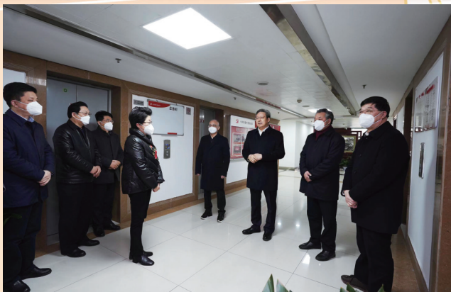
市委书记吴新明走访慰问市各民主党派、工商联机关