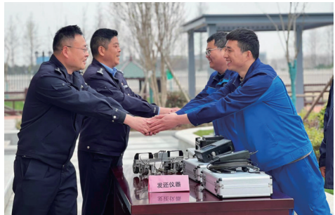
长航南通公安启东派出所民警找到企业“失联”仪器 护航企业高质量发展