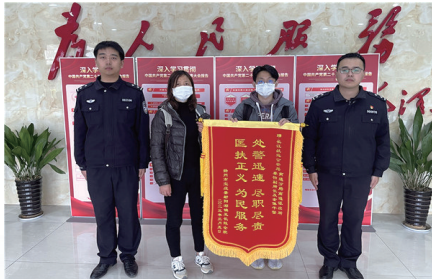
长航南通公安南通派出所妥善处置非正常死亡案件获锦旗两面

3月8日,素来相对平静的长航南通公安南通派出所,突然先后来了两拨人。这群人的脸上,都挂着满满的欣慰,还有难抑的激动。