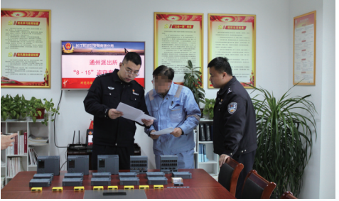
长航南通公安通州派出所民警向企业退还追回的被盗部件

这时的画面,令人动容。2022年8月,位于南通经济技术开发区长江沿岸的重工企业向长航南通公安通州派出所报案称,工程师在