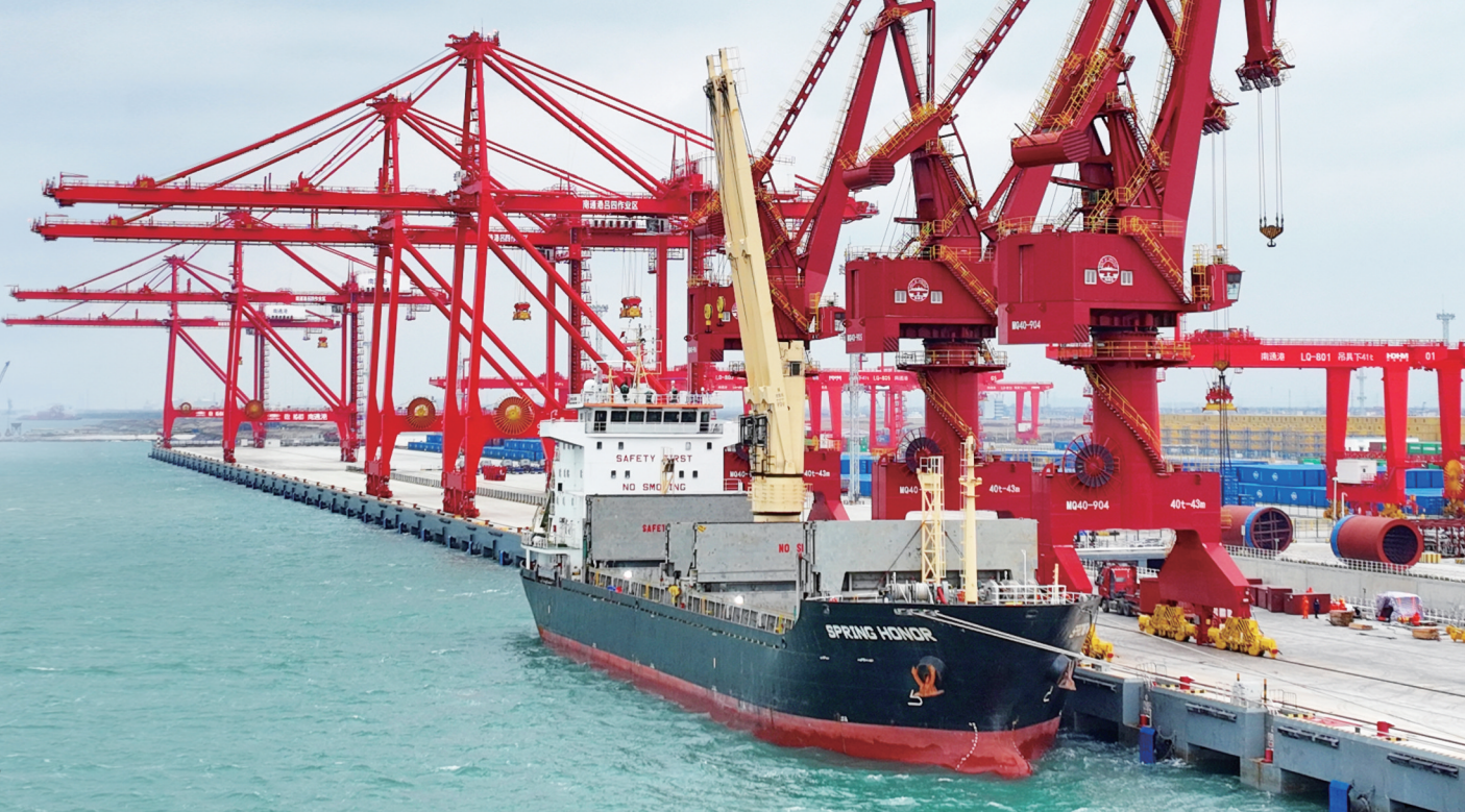
►通州湾新出海口吕四起步港区集装箱码头。