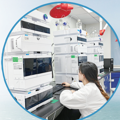
▲药源生物员工做检测实验。