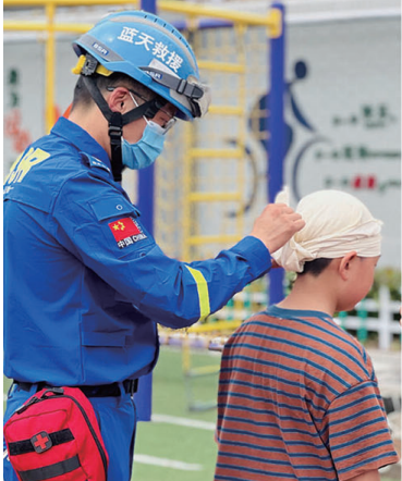
▲任港街道晨苑社区、南通蓝天救援队来到城西小学开展防灾减灾宣传活动。