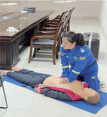
▲崇川经济开发区紫兴社区联合南通蓝天救援队开展应急救援知识宣讲活动。