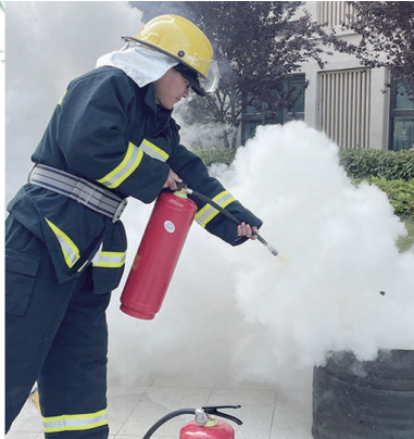
▲唐闸镇街道闸东社区开展应急救援演练。