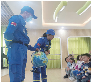
▲狼山镇街道临江社区联合南通蓝天救援队、临江幼儿园开展地震逃生演练。

5月9日，南通市崇川区幸福街道火车站专属网格工作站在南通火车站出站口揭牌成立。幸福街道通过构建“三合三提”服务模式，打造了全省首家24小时为旅客服务的交通枢纽专属网格工作站，推动网格组织体系、治理资源、工作机制、服务功能深度融合、同频共振新动力，让网格建设和基层治理在联动中相互促进。