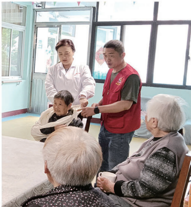
▼陈桥街道丽康社区工会到敬老院开展消防安全应急演练活动。