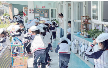
▲虹桥街道青年社区携手市应急管理局、市级机关第二幼儿园开展“以练筑防 安全童行”主题活动。