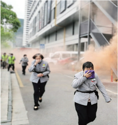
▲文峰街道联合五一社区、鲍家桥社区、易家桥消防救援站在印象城开展应急综合演练活动。