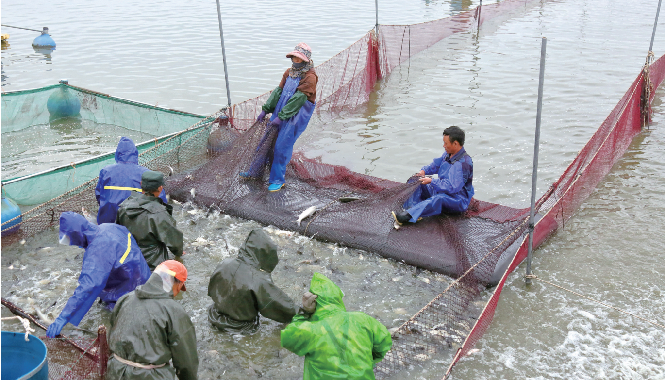
昨天，海安市墩头镇仇湖村村民正忙着捕捞鲜鱼准备出售。近年来，墩头镇大力实施“以鱼净水、养鱼增收”的生态治水模式，通过河道发包养鱼食草净水体的方法来管护水生态环境，实现经济效益和生态效益“双赢”。